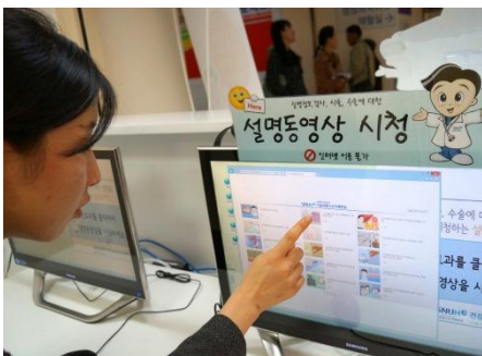
端末から健康に関する動画コンテンツが閲覧できる