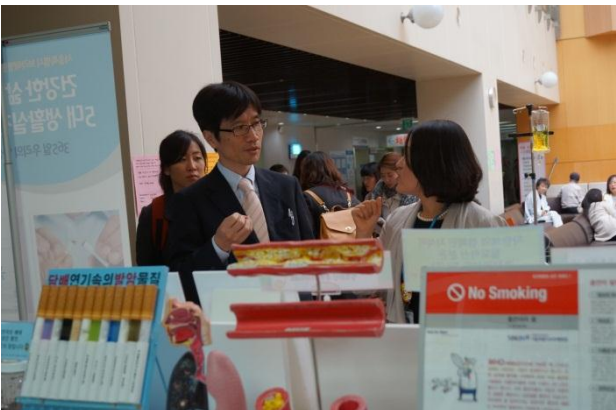
ヘルスプロモーションセンターで健康増進の取り組みを聞く(ボラメ医療院)