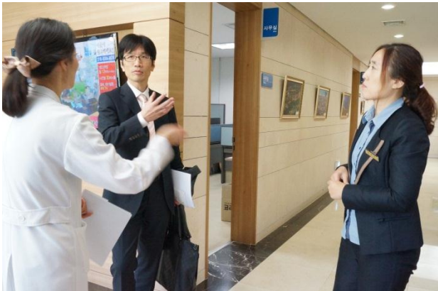
4月に当院を訪問した方との再会もありました(水原医療院)