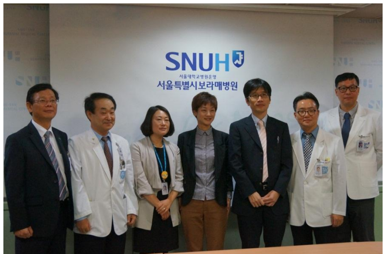
韓国のみなさんからはどこに行ってもとても温かく歓迎されました(ボラメ医療院)