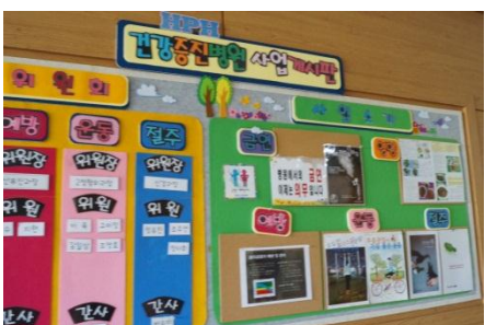
掲示板には目を引く HPH の活動を掲示(水原医療院)